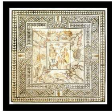
Mosaïque Diane et Callisto tirée des Métamorphoses d'Ovide. IIIème siècle après JC. (2.96m x 2.71m)

La résidence des seigneurs de Villelaure fut à l'origine une simple bastide dont la construction se situe vraisemblablement dans les années qui suivirent le repeuplement du village en 1512. Une première série d'agrandissements réalisée avant 1563 donna à l'édifice des dimensions plus importantes : le propriétaire Melchior Forbin entreprit de faire de cette demeure encore modeste un véritable château, inspiré du château de la Tour-d'Aigues. Ajout d'une fontaine et d'un pigeonnier peu après. Les successeurs abandonnèrent l'édifice à des fermiers qui le transformèrent en granges et en étables. Le vieux logis est remis en état après un incendie au XVIème siècle par les troupes vaudoises venues en représailles, le seigneur Gaspard de Forbin transforme et agrandit alors le bâtiment en 1560. A ce jour c'est une propriété privée.