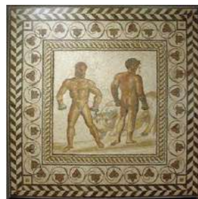
Mosaïque Darès et Entelle, II e siècle après J.C (2.08m sur 2.08m)